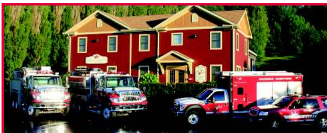
La caserne de pompiers, située au 96, rue Raymond-Lemieux, a été inaugurée le 15 décembre 1996.