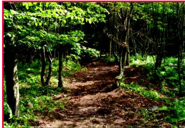
Une photo du sentier des Montagnards, un projet soutenu dans le Canton de Shefford par le Pacte rural en 2013

www.cld.haute-yamaska.com ou sur demande.